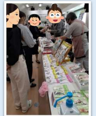
幸区社会福祉大会の様子