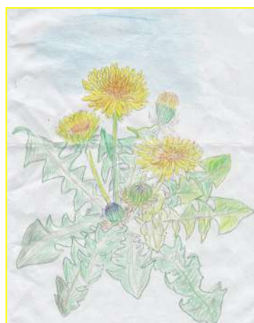
私の好きな花 K.Tさん